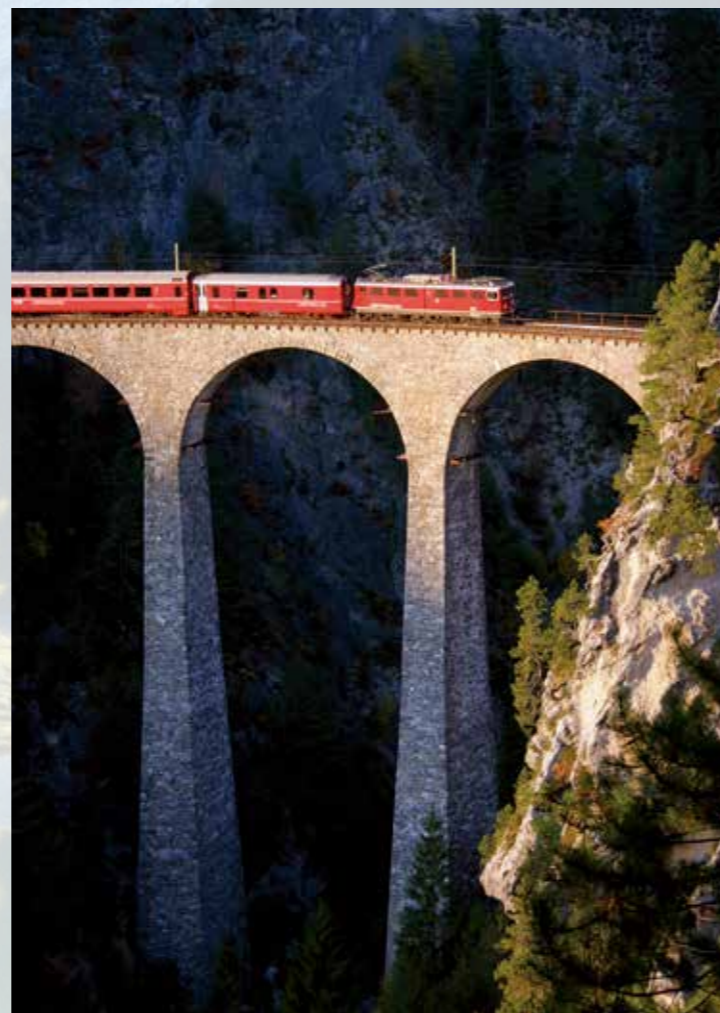
Schwelgen im Bahnparadies ...