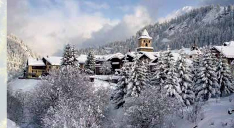
Dorfbild und Kirchen bestaunen ... Kulturstreifzüge ...