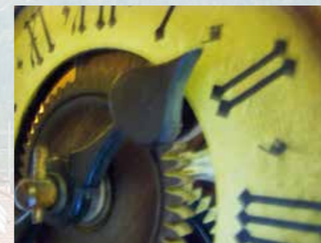
Schlafen wie ein Murmeltier ...

Restaurant Heimeliges Restaurant, historische Stüvetta (Arvenstube), rustikale Chamineda (alte Vorratskammer), schöner Saal und ein Gartenrestaurant mit Bergsicht. Ferienwohnungen Fünf komfortable Nichtraucher-Ferienwohnungen im Nachbarhaus «Chesa Crusch Alva» mit bis zu sechs Betten und Balkon oder Gartensitzplatz. Jedes Stockwerk ist per Lift erreichbar.