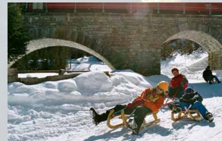
Schlitteln, schlitteln, schlitteln ...