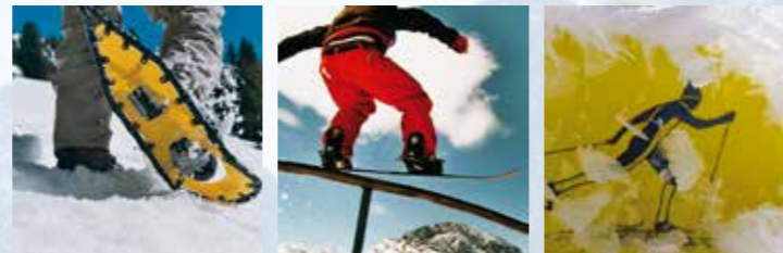
Schnee- und Schlittschuhlaufen ... Gipfel stürmen, Berge versetzen ...