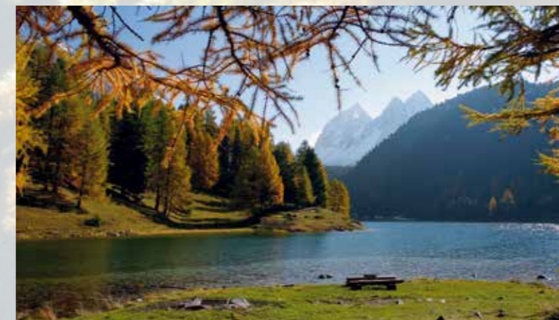
Eintauchen in unbeschreibliche Landschaften ... ... Golf und Tennis spielen, fischen