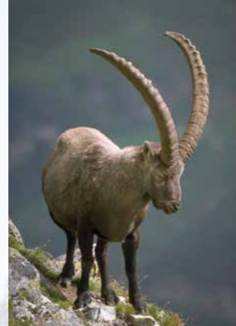
Wild beobachten ...