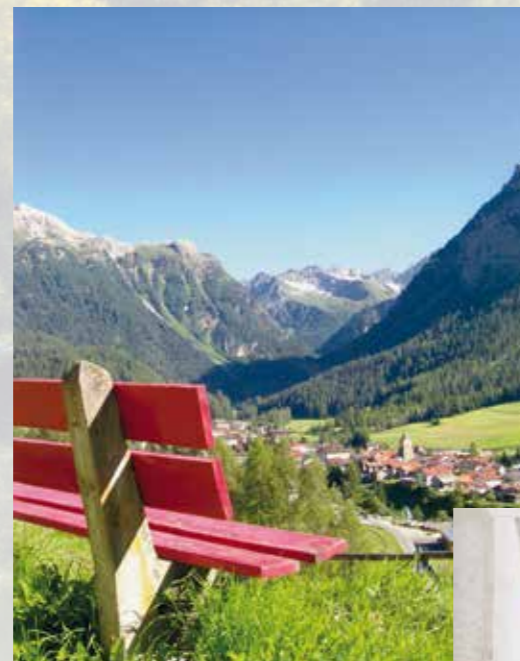
Spazieren, wandern, baden ...

Telefon +41 (0)81 410 50 10 Telefax +41 (0)81 410 50 11 weisseskreuz@berguen.ch www.weisseskreuz-berguen.ch