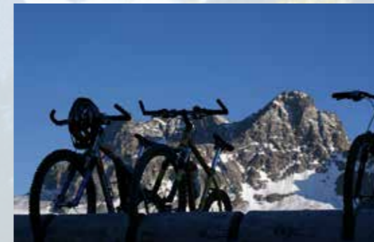
Biken, Motorradfahren ...