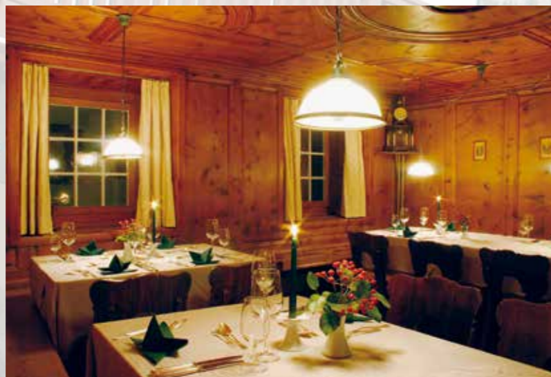
Freunde treffen, lachen, diskutieren ...

Überhaupt: Was wären wir ohne unsere Gäste und Freunde, die in diesem wunderschönen Hotel getrunken, gegessen, Feste gefeiert, gewohnt und sich erholt haben? Ihnen danken wir ganz herzlich und freuen uns auf alle, die noch und vor allem auch wieder kommen werden!