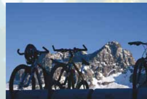
Biken, Motorradfahren ...