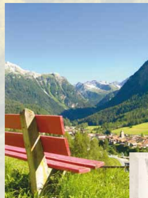
Spazieren, wandern, baden ...

Telefon +41 (0)81 407 11 61 Telefax +41 (0)81 407 11 71 weisseskreuz@berguen.ch www.weisseskreuz-berguen.ch