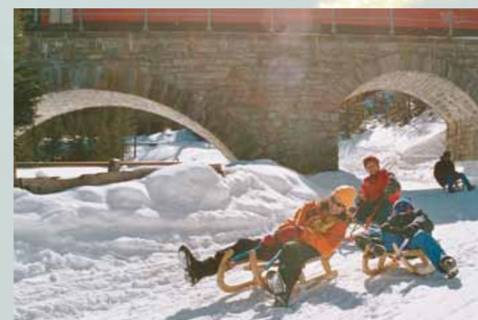
Schlitteln, schlitteln, schlitteln ...