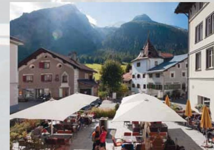
Staunen, erholen, entspannen, lesen ...

Questa vecchia fattoria engadinese del 16° secolo è stata trasformata in albergo nel 1889 e sottoposta a una vasta riattazione in 2003. Sperimentate la calorosa ospitalità del meravigliosa paese di Bergün! Provate gli eccellenti piatti e vini del nostro accogliente ristorante, della storica Stüvetta o della rustica Chamineda. Bella sala e nuovo ristorante con giardino.