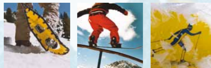
Schnee- und Schlittschuhlaufen ... Gipfel stürmen, Berge versetzen ...