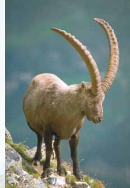
Wild beobachten ...