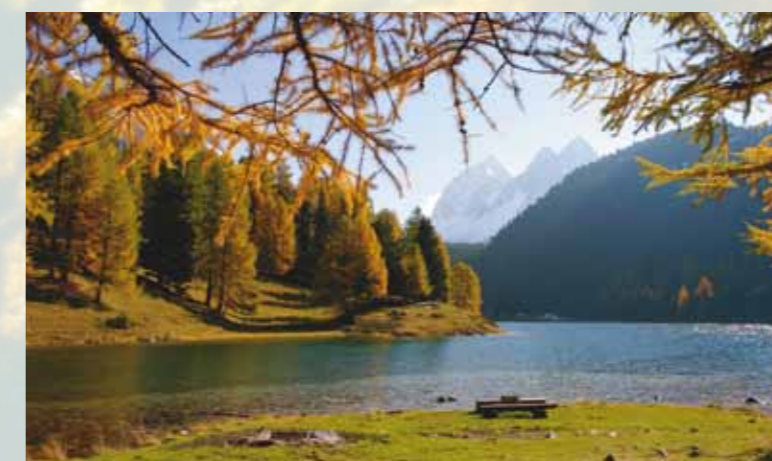
Eintauchen in unbeschreibliche Landschaften ... ... Golf und Tennis spielen, fischen