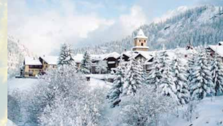
Dorfbild und Kirchen bestaunen ...