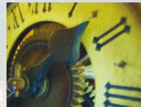
Schlafen wie ein Murmeltier ...

Restaurant Heimeliges Restaurant, historische Stüvetta (Arvenstube), rustikale Chamineda (alte Vorratskammer), schöner Saal und ein Gartenrestaurant mit Bergsicht. Ferienwohnungen Vier komfortable Nichtraucher-Ferienwohnungen im Nachbarhaus «Chesa Crusch Alva» mit bis zu sechs Betten und Balkon oder Gartensitzplatz. Jedes Stockwerk ist bequem per Lift erreichbar.